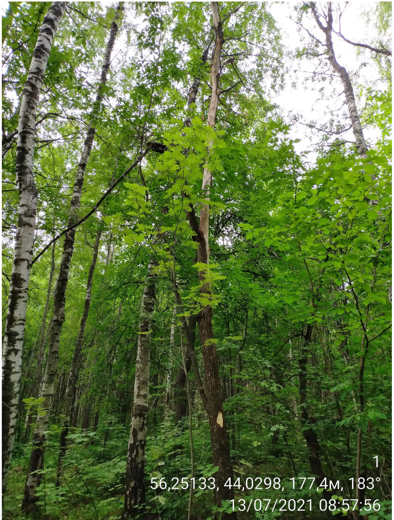
Дерево № 1 (Стволовая гниль)