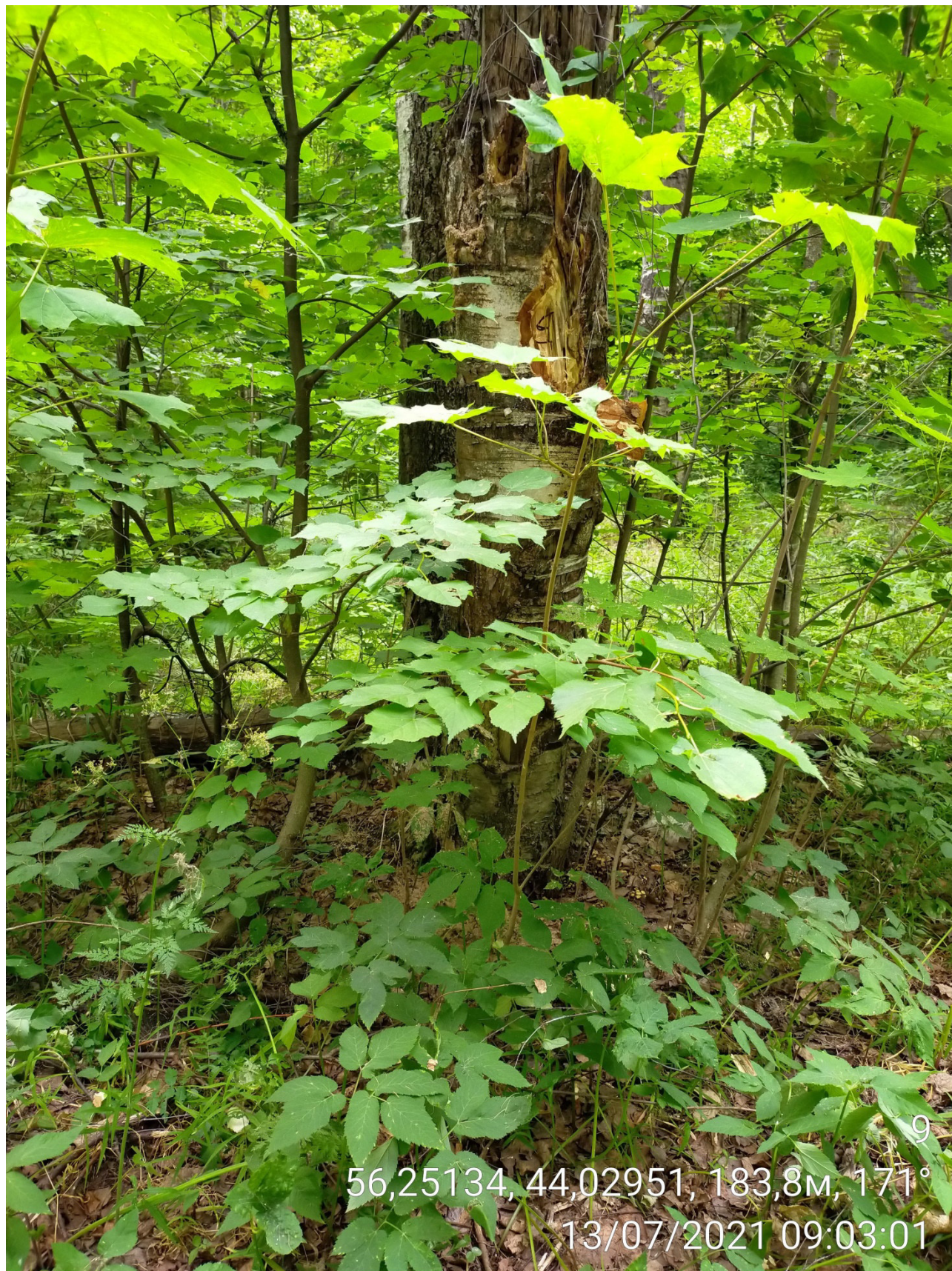
Дерево № 9 (Стволовая гниль)